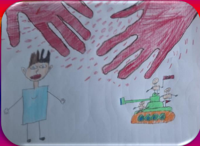
Muhammet Emin ÇELENK 6/A