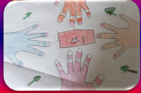
Mustafa Yiğit ÖZCAN 6/A