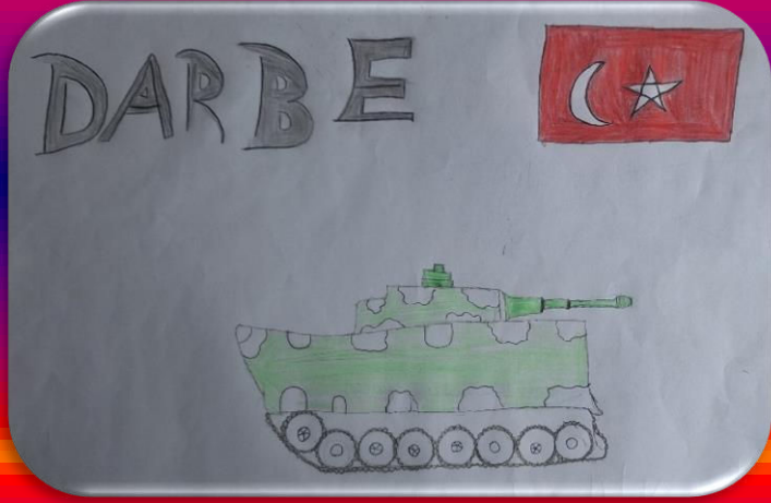
Neslihan YILMAZ 6/A