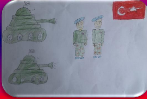
Özün Naile UYSAL 6/A