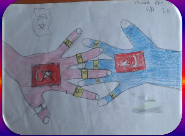
Mustafa Yiğit ÖZCAN 6/A