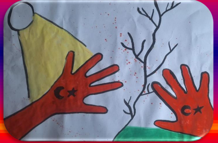
Nehir UYSAL 6/A