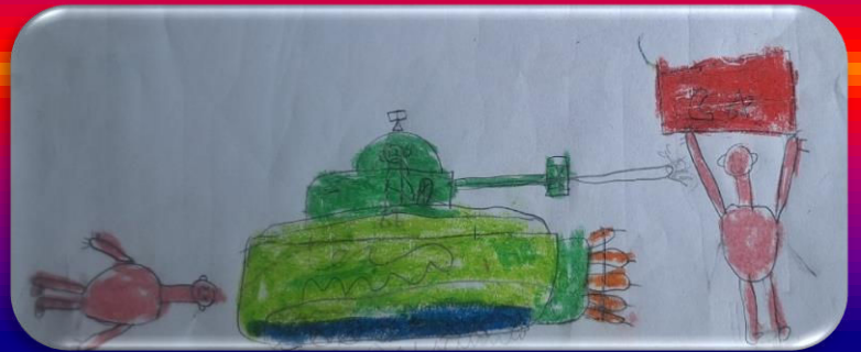
Yunus Emre ÖNCÜL 6/A