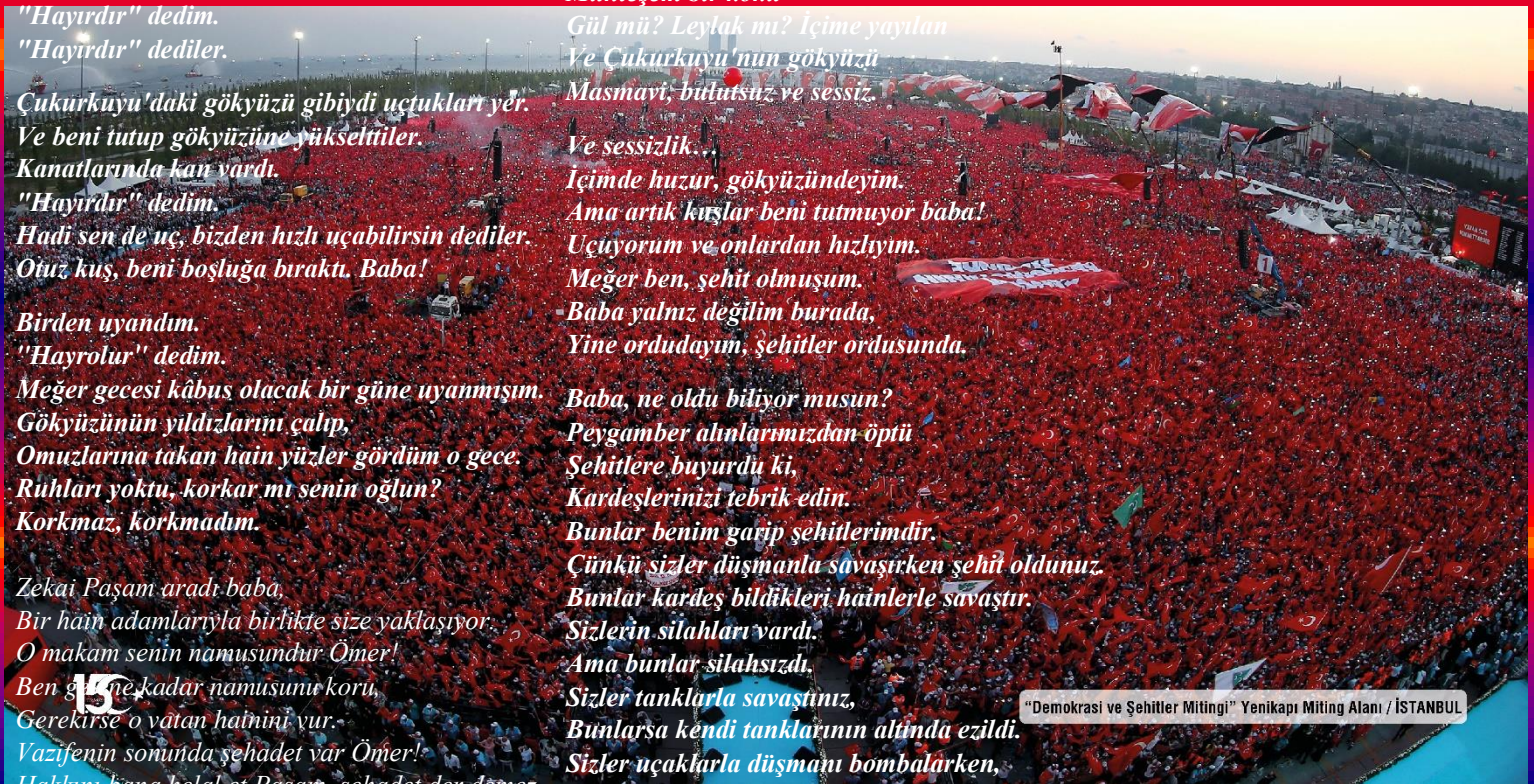
"Demokrasi ve Şehitler Mitingi" Yenikapı Miting Alanı / İSTANBUL