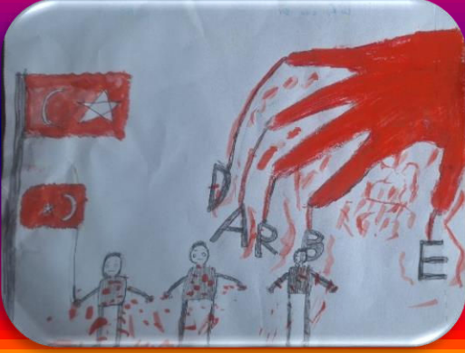
Efe Can OR 6/A