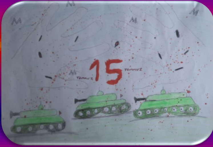
Kayra Yağız TÜRK 6/A